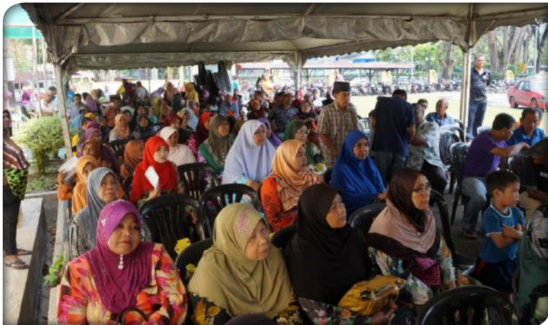
Majlis Penyampaian Bantuan Bulanan bersama Pembayar Zakat Daerah Taiping pada 26 Februari 2015.