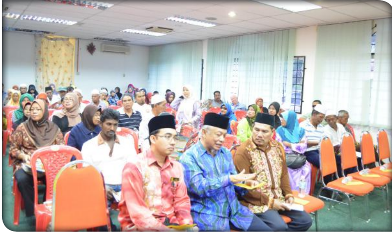
Majlis Penyampaian Bantuan Bulanan Asnaf Fakir dan Miskin Daerah Parit Buntar pada 29 Januari 2015.