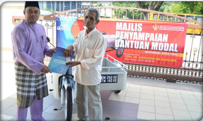
Majlis Penyampaian Motorsikal Roda Tiga kepada penerima oleh Ketua Pegawai Eksekutif MAIPK pada 27 Januari 2015.