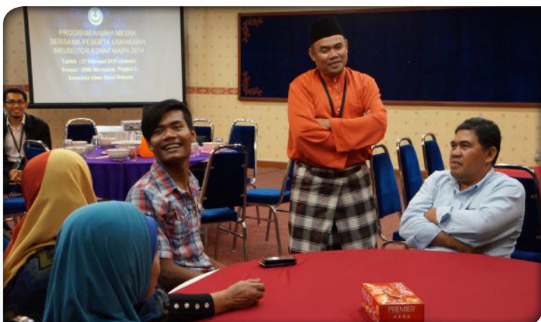
Program Ramah Mesra bersama Peserta Usahawan Inkubator Asnaf MAIPK 2014 pada 27 Februari 2015.