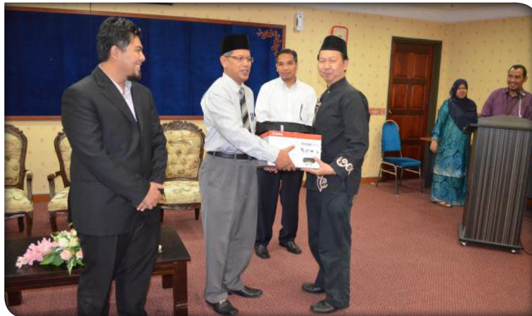
Sumbangan pencetak warna dan komputer riba kepada mubaligh-mubaligh pada 10 Mac 2015.