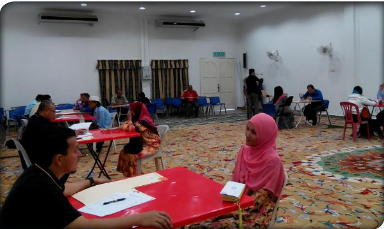
Ops Siasatan Permohonan Zakat Daerah Batu Gajah di Masjid Daerah Batu Gajah pada 21 Januari 2015