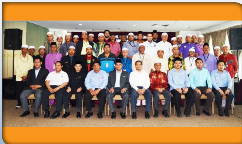
Taklimat Amil Harta dan Profesional Zon Selatan pada 15 April