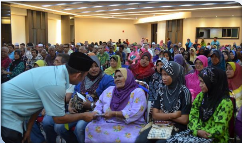
Majlis Penyampaian Bantuan Kewangan Bulanan dan Motivasi Asnaf Daerah Ipoh pada 24 Februari 2015.