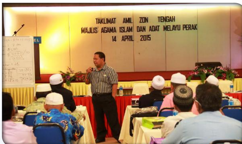
Taklimat Amil Zon Tengah pada 14 April 2015.