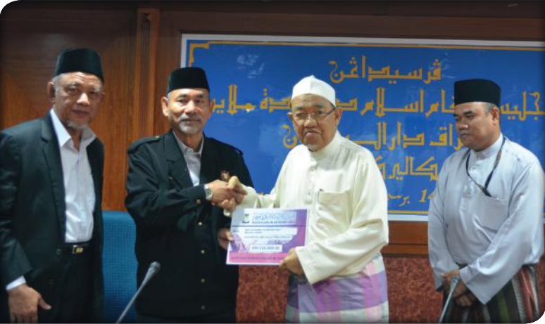
Lawatan dari Majlis Agama Islam Johor bagi sumbangan mangsa banjir di Negeri Perak pada 09 Januari 2015