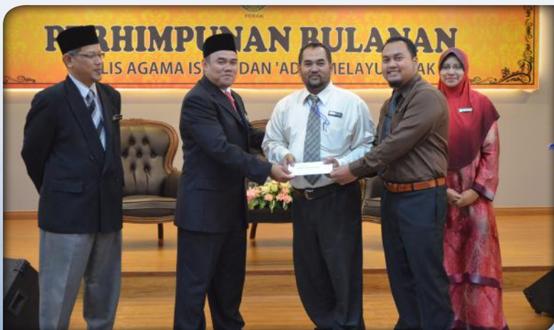
Perhimpunan Bulanan MAIPK Bil. 01/2015 pada 10 Mac 2015.